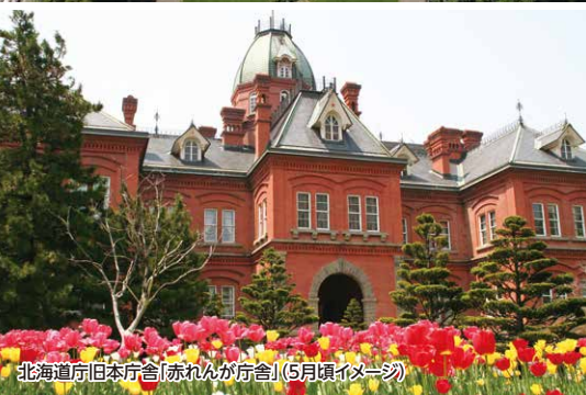
北海道庁日本庁舎「赤れんが庁舎」(5月頃イメージ)